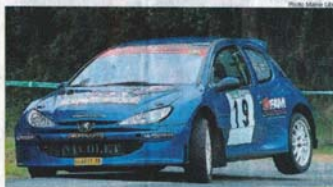
Bessé-sur-Braye fait partie des 2 seuls rallyes nationaux du Grand-Ouest.

Un rallye qui réunira en outre « tout le Grand Ouest, avec le Centre, des Normands, Bretons, Ligériens, Charentais... Par contre, les Vosgiens seront absents ».